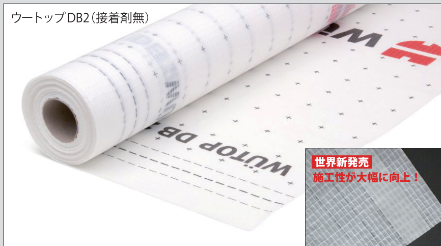
ウートップDB2(接着剤無)

ウートップ DB2 SK (接着剤付) 品番: KM-DB-2314501 新製品